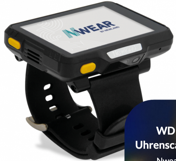
WD1 Uhrensanner Nwear